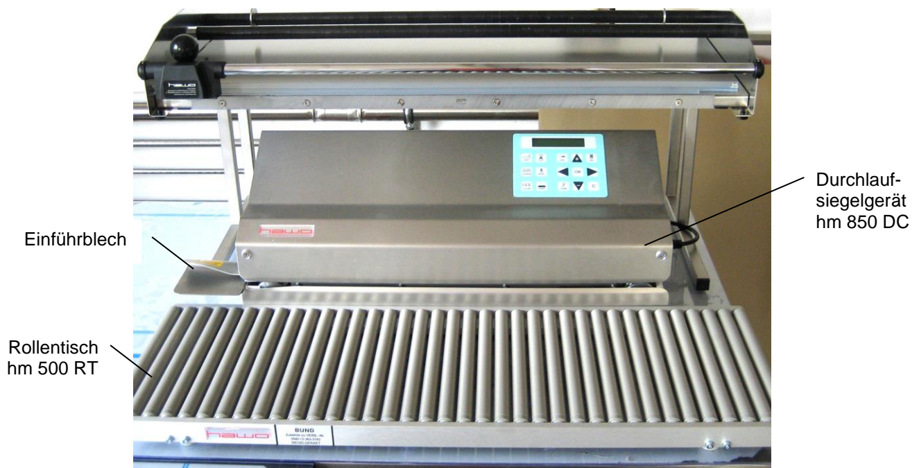
Abb. 2: Platzierung von Untergestell, Folienrollenspender und Durchlaufsiegelgerät:

Montage: Sterngriffschrauben lösen und durch die Seitenteile mit der Querstrebe verschrauben.